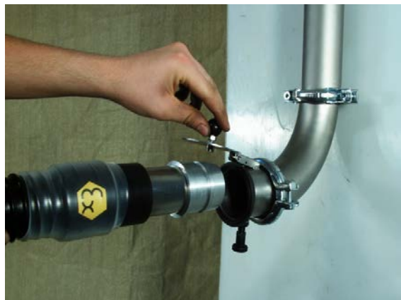
Optional mit Steuerung und Füllstandskontrolle

Die Schlauchanschlussdose kann ohne größerem Aufwand an eine Hausverrohrung angeschlossen werden. Um den Saugschlauch anzuschliessen wird der Deckel an der Dose hochgezogen und der Stecker eingesteckt. Durch einen Einrastbolzen wird der Anschlussstecker fixiert.