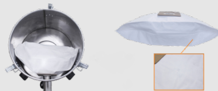
Aufnahmebeutel aus Mikrofaser, mit Verschluss