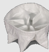
M-Filter + antistatisch