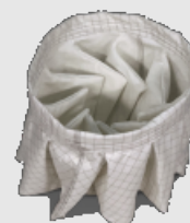
M-Filter + antistatisch