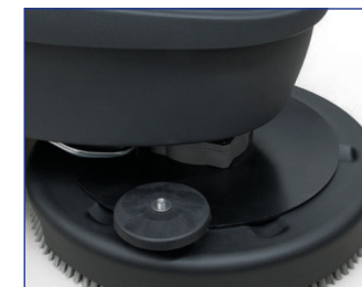
Arbeitsbreite 50 cm

Durch die übersichtlichen Bedienelemente und die einfach zu wechselnde Bürste mit Bajonett-Verschluss ist die Airflex äußerst bedienungsfreundlich.